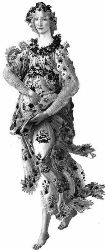
La primavera – vårens ankomst på Botticellis härliga målning. Den kommer!

Efter en del kristerapi i egen regi lugnade det ner sig efter ett tag och frukostarna blev lugna och härliga igen och i nutid upplever jag just att de första snödropparna har börjat sticka upp med hårt knutna knoppar överst. Det finns fortfarande hopp om en varmare framtid!